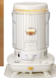
電池式 灯油ストーブ 5台