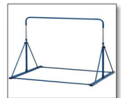
支援物資: 移動式鉄棒 跳び箱用 踏切り板